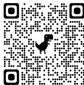
学科/専攻 YouTube チャンネル